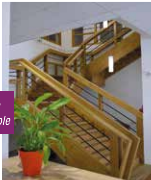
Escalier au matériau noble