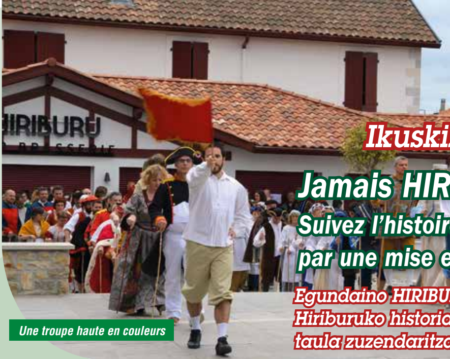
Une troupe haute en couleurs