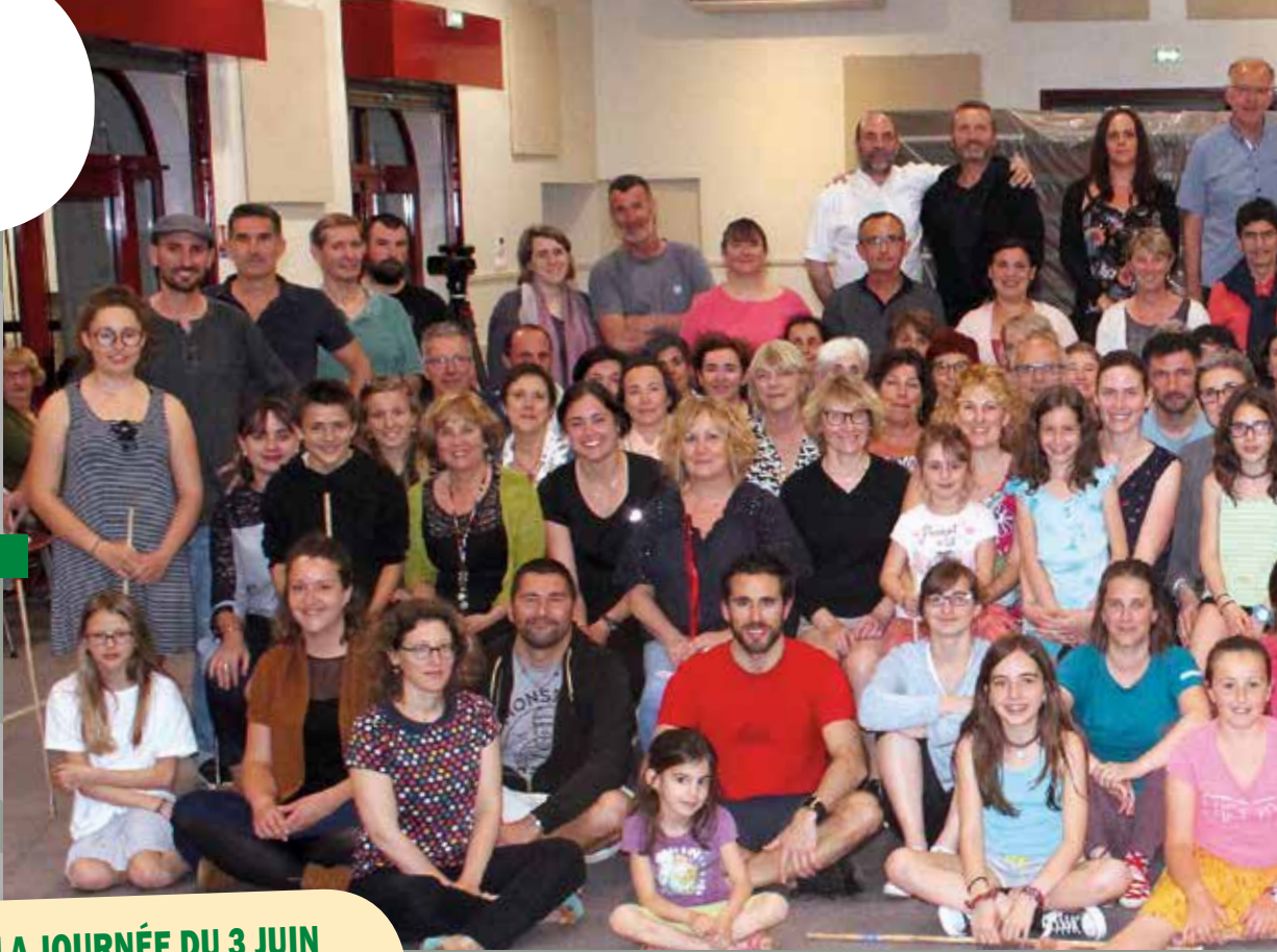
La troupe d'acteurs