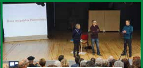
"Le bien et le mal dans la pastorale »

Les transformations subies par La Perle permettent à la salle d'avoir une double fonction.