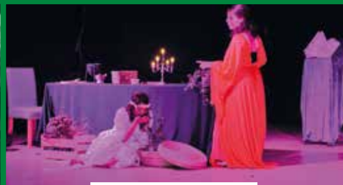
"Sorcières" sur scène