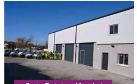
Centre Technique Municipal