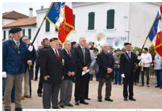
8 mai : Cérémonie aux Monuments aux Morts

Toutes les guerres sont cruelles, particulièrement celles qui cachent leur nom.