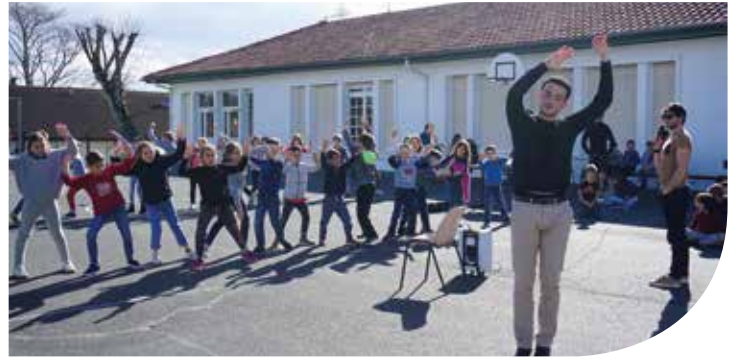
Démonstration écarteur landais