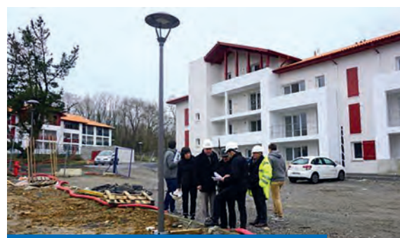
Visite du chantier à Landa Lorea