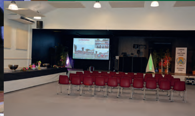
La salle La Perle rénovée