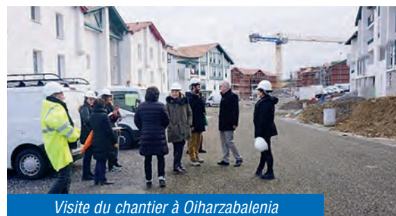
Visite du chantier à Oiharzabalena

Deux autres programmes seront livrés en juin : Landa Lorea et Oiharzabalena, au total 190 logements sociaux avec des jeux pour enfants et des espaces verts partagés.