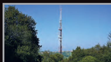
Faut faire avec