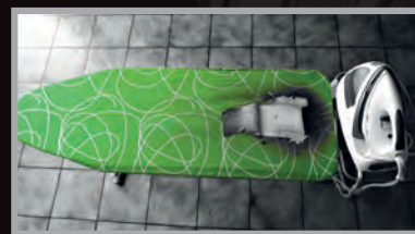
Etre au bout du rouleau