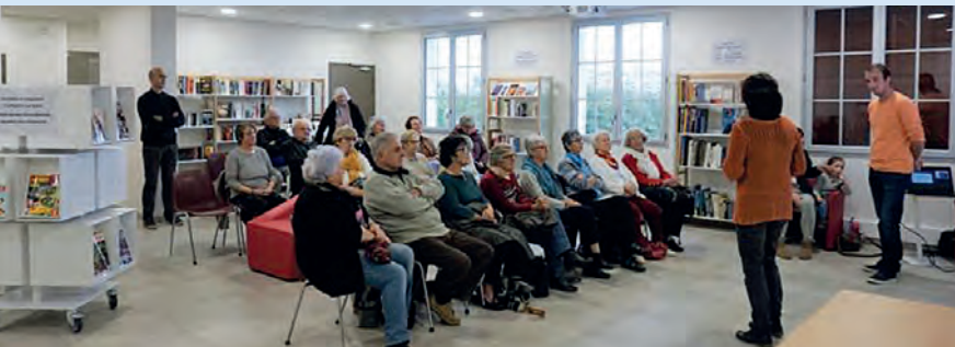
Conférence sur les bienfaits de l'activité physique le 8 novembre