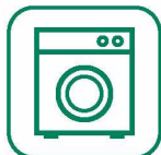
GROS ÉLECTROMÉNAGER Tresneria larria

Par déchets d'équipements électriques et électroniques (DEEE), on entend tous les produits fonctionnant soit par un branchement avec une prise électrique soit avec une batterie.