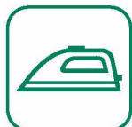
PETITS APPAREILS MÉNAGERS Etxe tresneria xehea

Gros électroménagers froid (GEM F) : appareils frigorifique (réfrigérateur, congélateur, climatiseur fixe ou mobile, ...)